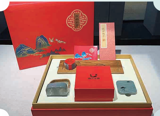
故乡的云系列产品