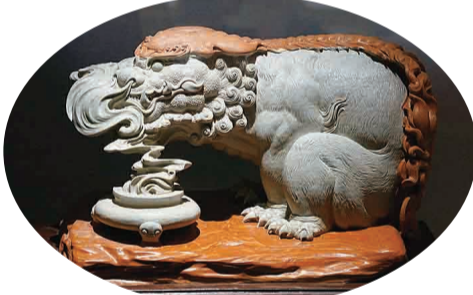
龙生九子松花石之二