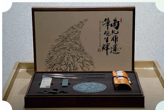
南北非遗 笔砚生辉