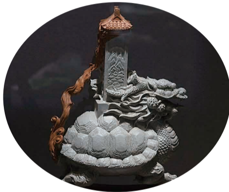
龙生九子松花石之一

目前，江源区域内从事松花石生产经营企业和商户近200家，具有一定规模企业33家，配套企业16户，松花奇石、松花砚、松花石工艺品等松花石产品的年生产能力突破80万余件，在带动就业和增加税收上发挥了越来越强大的促进作用。